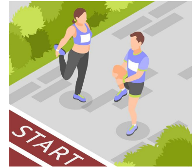
Opwarming atleetjes op wedstrijd